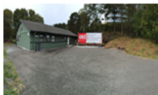
After care: MOT82 ved U82