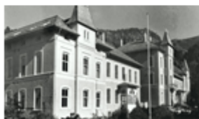
Acute-phase prevention (Sandviken)

Concerning research, our working group has identified two levels. On the one hand we need qualitative research with a user perspective. In MOT82 a user perspective will be exploring how users experience music therapy. It will include action research, case studies, field work, interviews, exploring the user-ask-user-method, co-researching, etc.