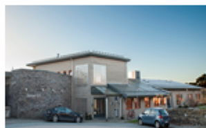
Treatment - DPS